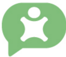
Figura 2. Componentes vertebrales del Marco de Protección a través de la Participación (PAP).